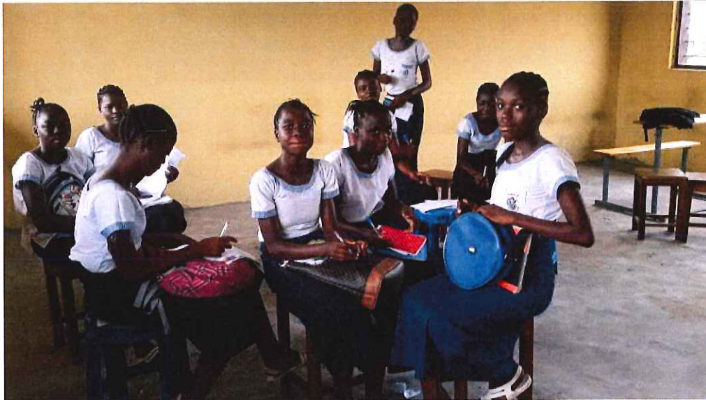
Foto 3. Alumnas en una de las salas reservadas para ellas (el equipamiento iba a comenzar a ser instalado en los días siguientes a la evaluación)