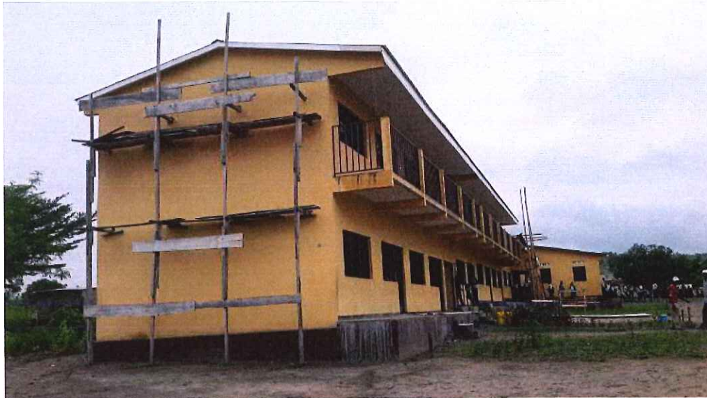
Foto 5. Nuevas infraestructuras desde otra perspectiva