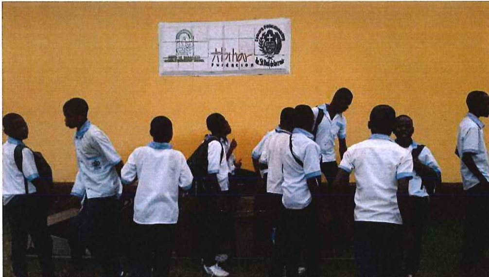
Foto 1. Detalle de la placa identificativa de la Escuela M.M. Frescobaldi